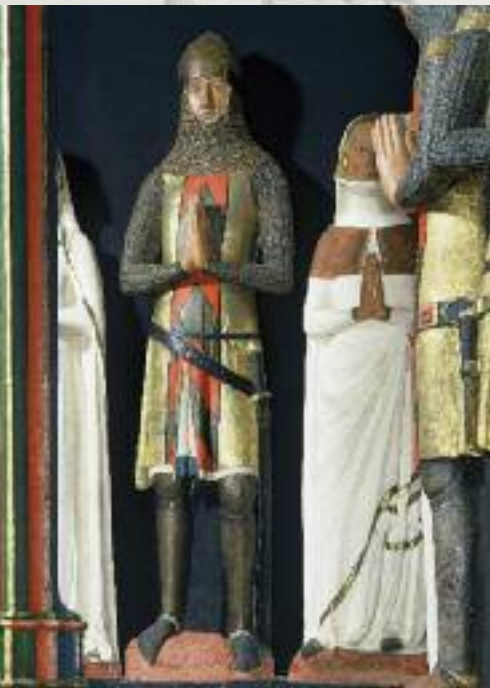
Grabmal Ludwigs von Neuenburg, 1372 Collégiale Neuchâtel NE