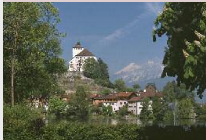
Burg und Städtchen Werdenberg SG