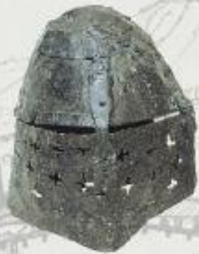
Topfhelm, 1. H. 14. Jh. Madeln BL