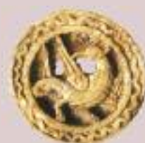
Spielstein, 11. Jh. Altenberg BL