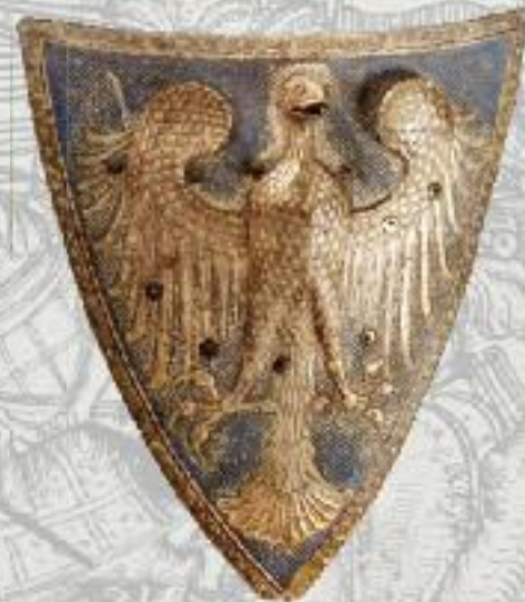
Schild der Herren von Raron, um 1300 Sion VS