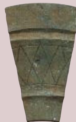
Holzbecher, 14. Jh. Marmorera GR

Doch auch die vielen von Legenden und Sagen umrankten Ruinen üben eine grosse Faszination aus. Während sie Historikern und Archäologen wertvolle Hinweise über die damaligen Lebensumstände liefern, lassen sie für den Laien Geschichte lebendig und begreifbar werden.