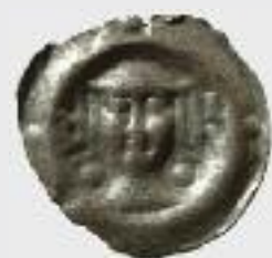
Pfennig Stadt Zürich, um 1400 Benden FL