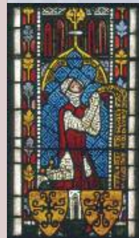
Glasgemälde, 1. H. 14. Jh. Kappel ZH