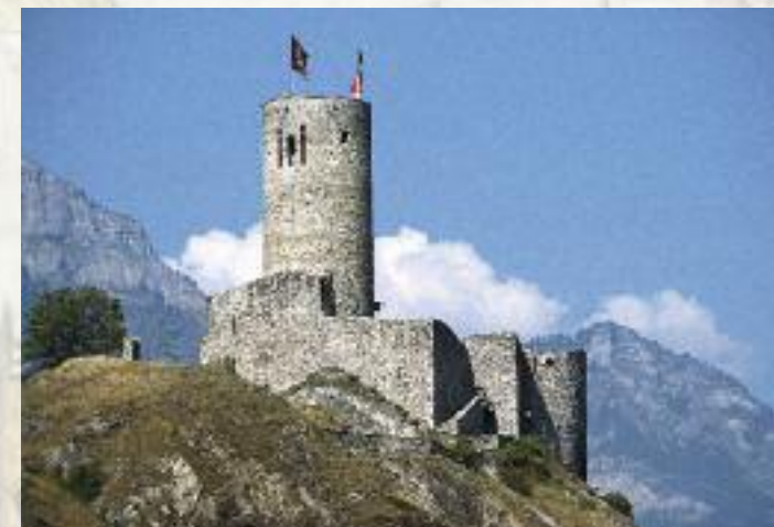
Burgruine La Bâtiaz, Martigny VS

Diesen Zeugen und Relikten widmet sich seit 1927 der Schweizerische Burgenverein. Als junge Institution setzte er sich anfänglich für den Erhalt von Burgen ein; heute stehen Forschung, Vermittlung und Sensibilisierung im Zentrum. Zusammen mit neuen Erkenntnissen über Burgen, Schlösser, Klöster, Kirchen und Wehranlagen werden regelmässig hochinteressante Aspekte der schweizerischen Archäologie und Kulturgeschichte des Mittelalters und der Neuzeit publiziert. Damit sollen Laien ebenso wie Wissenschaftler angesprochen werden, die sich für die Kultur- und Siedlungsgeschichte der vormodernen Epochen interessieren.