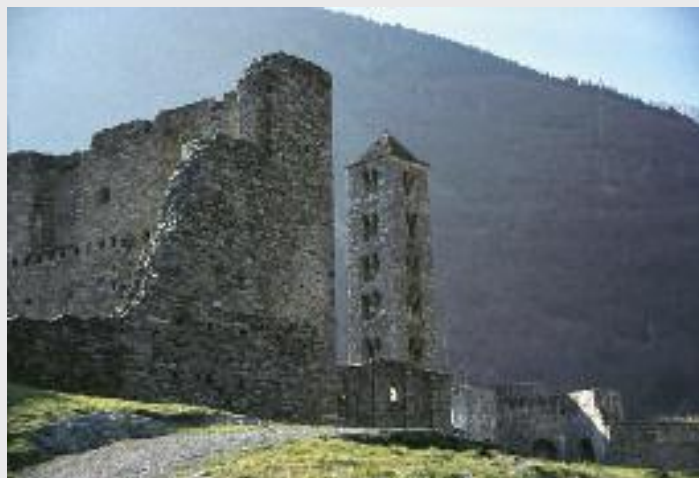
Burgruine mit Kirche San Carpofo, Mesocco GR