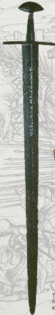
Eisenschwert, um 1300 Tschlin GR