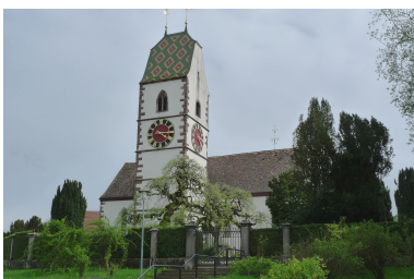
Foto: Die Bergkirche Neunkirch von NW

Die von weither sichtbare Bergkirche liegt auf einer Anhöhe südlich des mittelalterlichen Städtleins. Nach heutigem Wissen belegen Vorgängerbauten eine örtliche Kontinuität seit karolingischer Zeit. Der markante Turm an der Nordflanke wurde 1484 errichtet. Die Kirche, ursprünglich mit Langhaus und eingezogenem rechteckigem Chor, datiert aus dem frühen 14. Jahrhundert. In der Renaissance (1598) wurde sie mit einer toskanischen Arkadenstellung um ein Seitenschiff mit durchgehender Chorerweiterung verbreitert. Die Bergkirche gesellt sich damit typologisch zu einer speziellen Gruppe protestantische Renaissancekirchen. Die Decken in Schiff und Chor wurden 1748 in zurückhaltender Vornehmheit stuckiert. Die gekehlten Decken weisen axial ausgerichtete Spiegel und konzentrisch komponierte