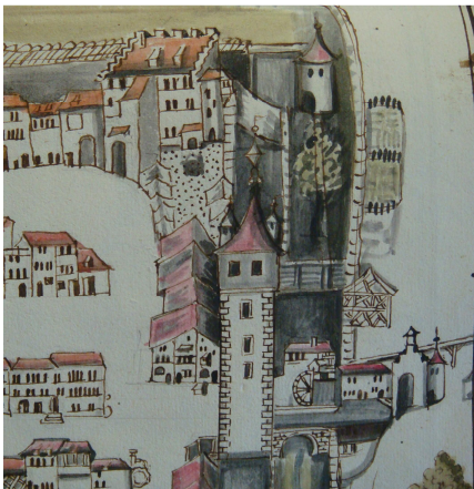
Abb. Johann Ludwig Schmid, Stadtprospekt Neunkirch 1725 (Ausschnitt).

Der Oberhof war ursprünglich Verwaltungssitz der vom Bischof von Konstanz eingesetzten Vögte. 1155 wird ein bischöflicher Hof in Neunkirch erwähnt. Ob es sich dabei um einen Vorgänger des heutigen Schlosses handelt, ist aber nicht sicher. 1330 jedenfalls hatte der bischöfliche Vogt, nach der Öffnung Neunkirchs, seinen Sitz im Dinghof. Spätestens 1436 war der Umbau des Dinghofes zum Schloss erfolgt. 1525 kaufte Schaffhausen vom Konstanzer Bischof Hugo von Hohenlandenbergr die Herrschaft Neunkirch. Fortan residierten die Schaffhauser Vögte im Schloss und die Herrschaft Neunkirch wurde zur bedeutendsten Vogtei Schaffhausens. Um die Mitte des 16. Jahrhunderts erfolgte ein erheblicher Umbau des Oberhofs. Mitte des 18. Jahrhunderts wurden die Zimmereinrichtungen der ‚Landvogtey-